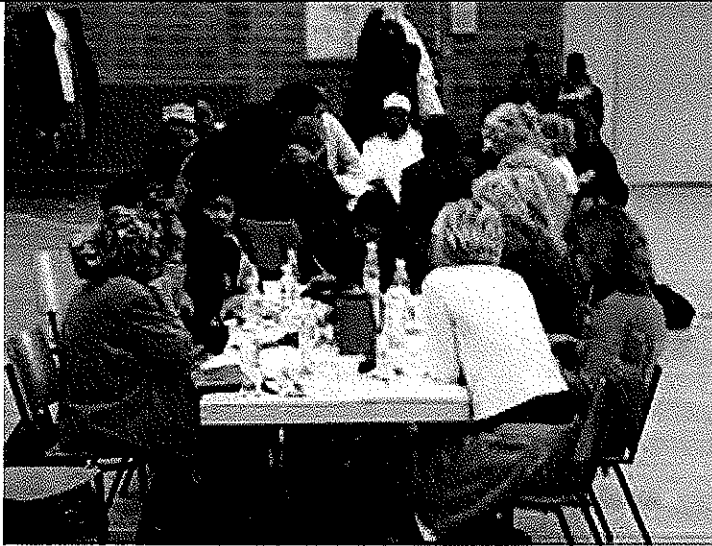
FGM seminar in Aarhus, November 25, 2008: Participating in Workshops.