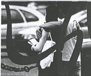
Vejledning til sundhedspersonale på sygehusenes børneafdelinger

Klinik for selvmordstruede børn og unge, Bjergegade 15, 1. sal, 5000 Odense C