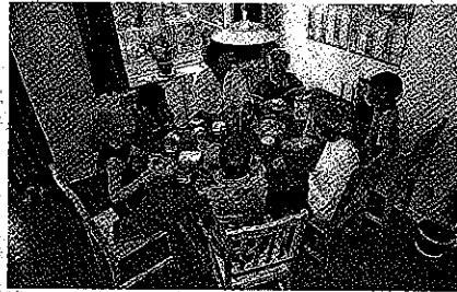
Så er der frokost

Pige på 4 år fortæller, at hendes far er i fængsel, fordi han har kørt uden dankort, og at maden derinde smager skide dårligt!!