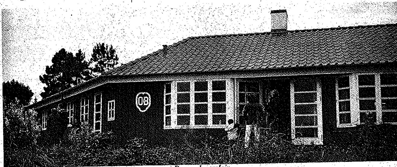
Den ny kongslejr

Men tiden var inde, også til forandringer. Igen. Mange af idéerne blev senere realiseret, ikke udelukkede på Chr. IX, men rundt omkring på de andre institutioner.