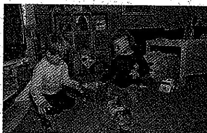
2 børn der leger på gulvet

"Her i de sidste år har summen af belastninger været mange gange voldsommere end i de tidligere år. Mange af dem, vi får anbragt, er uden grundlæggende værdier og normer. Følelsesmæssigt er de helt småret, de kan simpelthen ikke forstå verden omkring sig. Og den slags børn har altid været der, også hos os, men tidligere drejede det sig om en enkelt eller to i en gruppe, nu er det op til 5-6 stykker. Og billedet er desværre det samme, også på de andre institutioner... det er en af vores store udfordringer."