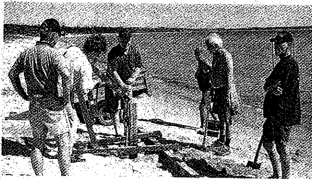
Medlemmer af foreningen sørger hvert år for, at badebroen i lejren bliver sat op og taget ned

Hvis du vil se mere eller gerne vil i kontakt med foreningen så kig ind på foreningens hjemmeside på www.cixbvenner.dk .