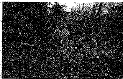
Hygge i det grønne

Chr. IX's Børnehjem var nu den eneste institution i Århus, der modtog børn akut, og det indebar også, at selvom der var godt fyldt op, sagde man aldrig nej til at tage imod. Og en akutanbringelse var for det meste ret så akut, ofte gik der kun få timer, fra man første gang blev orienteret, til børnene stod i døren. Og det var som regel børn, der havde været udsat for mishandling, omsorgssvigt eller sygdom.