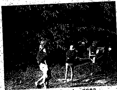
Kanotur i Sverige 1983