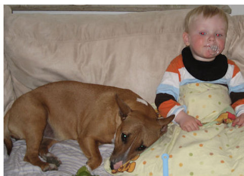
Miniature Bull Terrier Barca Fortrinlig babysitter og legekammerat

Det gælder også ejere af bull racer. Vi er præcis som alle andre "almindelige" mennesker med "almindelige" hunde.