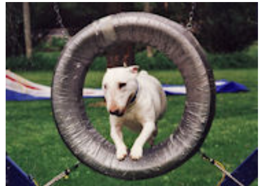
Miniature Bull Terrier Greg På agility banen

D.v.s. at under 20 % af de registrerede American Staffordshire Terriers har en stamtavle. De øvrige er altså blandingshunde. Hunde fra "alternative" klubber eller hunde, der bevidst er registreret som en anden race, end det rent faktisk drejer sig om.