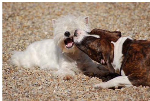
American Staffordshire Terrier Dio I leg med West Highland White Terrier

American Staffordshire Terriers har primo 2005 indført at for at kunne indgå i avl, skal alle American Staffordshire Terriers have en godkendt mentalbeskrivelse. Fra 2001-2008 er 218 American Staffordshire Terriers blevet mentalbeskrevet. Ud af disse blev 4 (1 i 2001 og 3 i 2006) ikke godkendt og blev dermed udelukket fra avl. Det giver en godkendelsesprocent på 98 ( se bilag | DTKs 4 bull racer ).