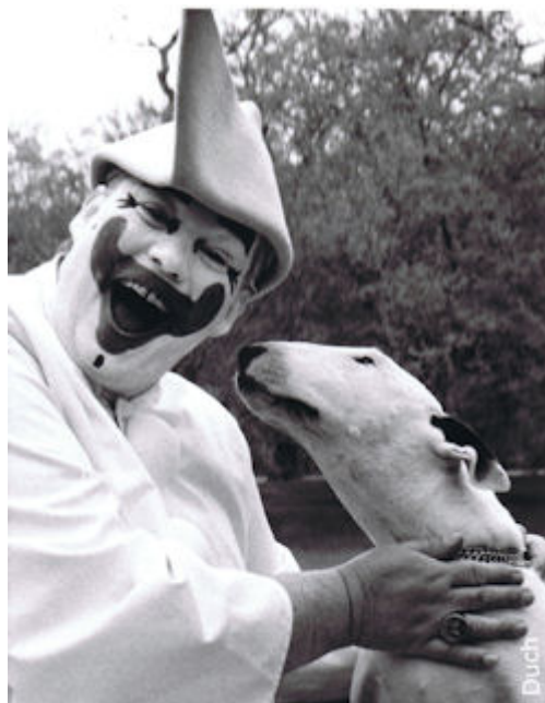
Bull Terrier Ami Med Bakkens Pjerrot som har optrådt med en Bull Terrier på Bakkens scene.

Mange af de hunde, der i medierne betegnes som kamp/muskelhunde, som forårsager disse problemer, er blandingshunde, illegale importører og/eller hunde, der ikke er registreret i Dansk Hunderegister. Det drejer sig i høj grad om dårligt opdrættede og dårligt opfostrede hunde, hvor sælger ikke prioriterer kritisk udvælgelse af nye ejere og rådgivning af disse samt ejere med utilstrækkelig kompetence.