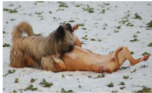
American Staffordshire Terrier Happy I leg med Skye Terrier

Sikring af at den useriøse hundeejer påføres alle lovpligtige omkostninger ved at have hund, kan gøre hundeholdet mindre attraktivt.