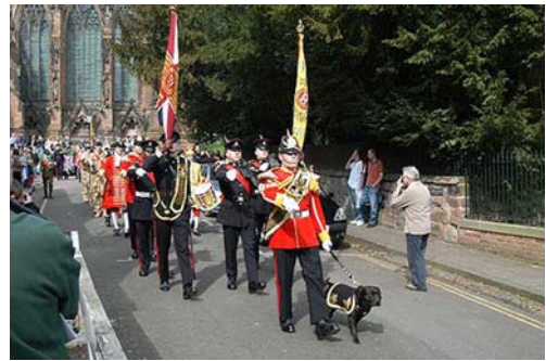
Staffordshire Bull Terrier Watchman Maskot for Staffordshire regimentet (UK)

Det uorganiserede "hundemarked" kan desuden producere nye varianter af blandingshunde, som appellerer til folk, der ønsker en "farlig" hund. Blandingerne kan ikke racebestemmes. Bull racer, molosse racer eller andre grupper af hunde, som er i offentlighedens søgelys, indgår ikke nødvendigvis i disse blandinger. Desuden findes der allerede – i udlandet – racer, som vil have stor appel til dette marked – og som uhindret kan importeres.