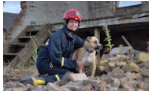
American Staffordshire Terrier Knirke Under uddannelse til redningshund