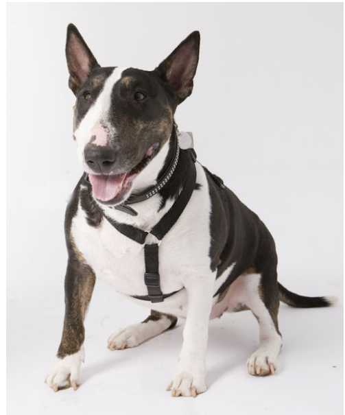
Bull Terrier Naomi Finalist i Danmarks Sødste Hund 2007 (Vi med hund)

Det gik til og med ud over andre racer end dem, der var ramt af lovgivningen, da mennesker uden viden om hunde ikke kunne se forskel.