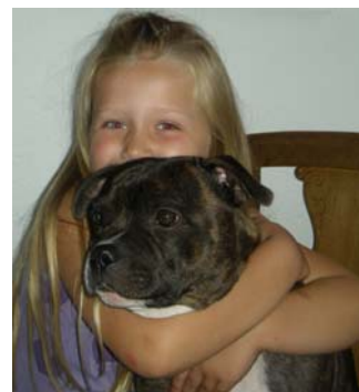
Staffordshire Bull Terrier Tafi The Nanny dog

Nedenstående skal begrænse den ulovlige import af ofte alt for unge uvaccinerede hvalpe og andet use-riøst opdræt af dårligt opfostrede hunde. Området giver også stort råderum for sort økonomi.