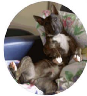
Miniature Bull Terrier Larry Bullere trives vældig godt som sofahunde.

Vi tror dog ikke, at det er praktisk muligt at indføre, administrere og kontrollere et hundekørekort og reelt opnå et positivt resultat af indsatsen. Gennemførelse af dette forslag forudsætter, at alle hunde i Danmark registreres i Dansk Hunderegister.