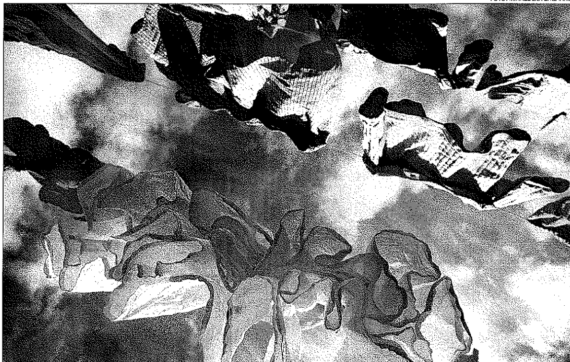
Når vi sparer på strømmen og hænger tøj ud til tørre, så betyder det blot, at de energitunge virksomheder ikke behøver spare helt så meget for at leve op til kvoterne.

Kommentarer og spørgsmål til denne rubrik bedes sendt til: olebalslev@mail.dk