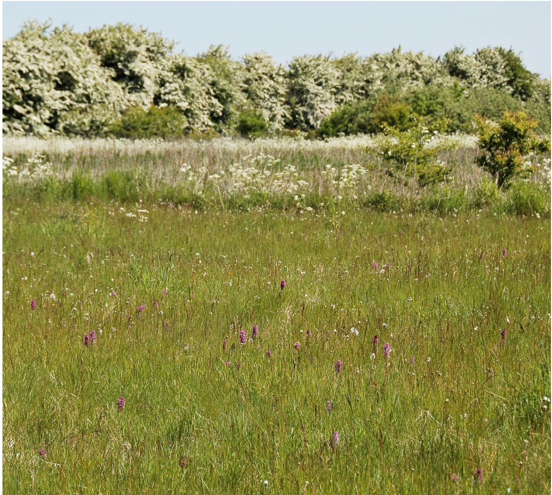
April 2008. Orkideerne trivedes i stort antal på engen.