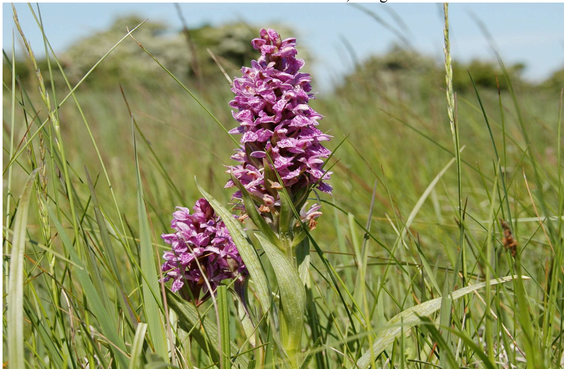
April 2008 Orkideen gøgeurt voksende på engen