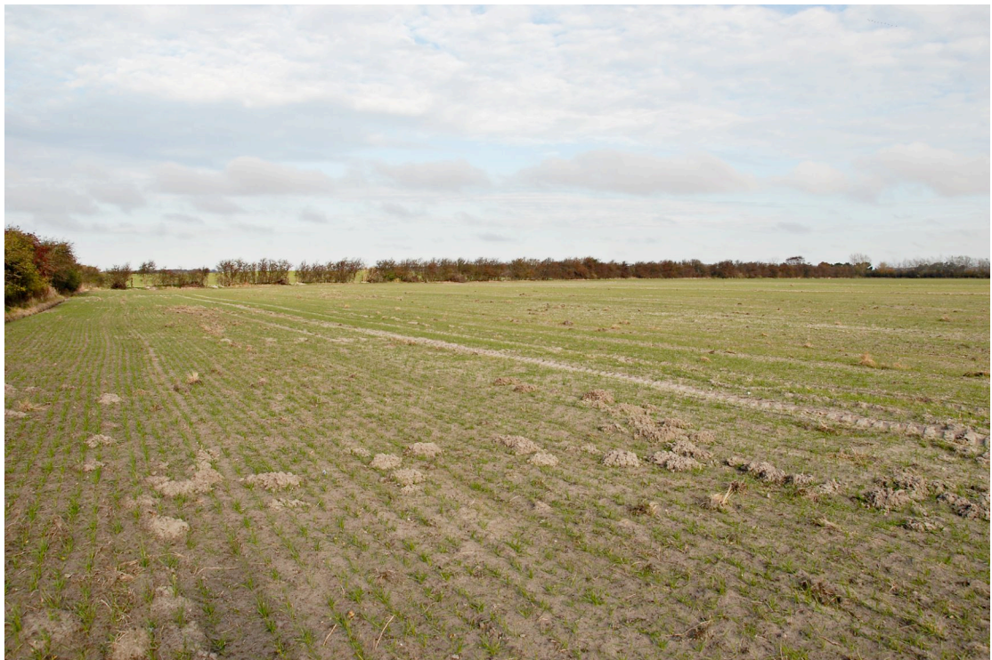
November 2008. Engen og orkideernes levested, er blevet til en kornmark.