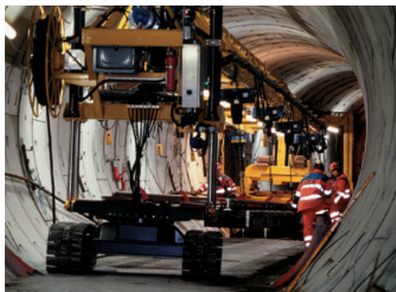
Foto i denne pjece stammer fra etableringen af den eksisterende Metro i København.

Du kan følge arbejdet med Cityringen på Metroselskabets hjemmeside www.m.dk/cityringen . Her vil selskabet løbende underrette om udviklingen i anlægsarbejdet, frem til Cityringen er klar til åbning.