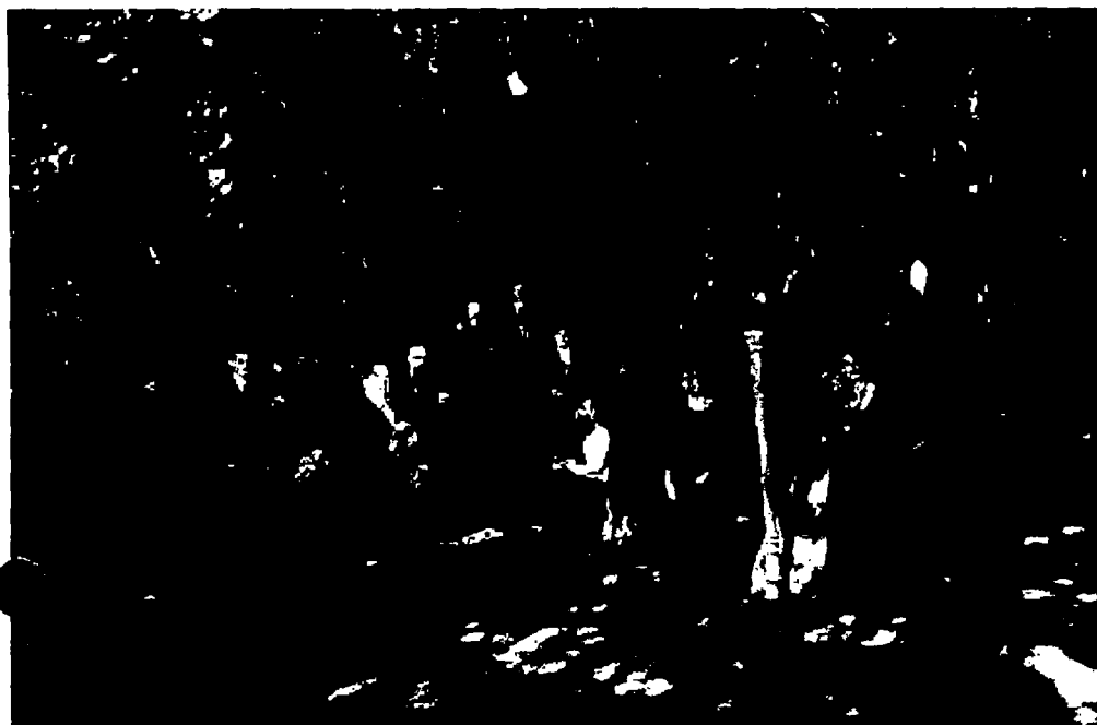
Storstrøms Kammerensemble får fortsat bevilliget støtte fra musikudvalget, men skal også rejse lokal finansiering.

Hold dig orienteret om situationen med Det Jyske Ensemble her: www.dmf.dk/jyskeensemble