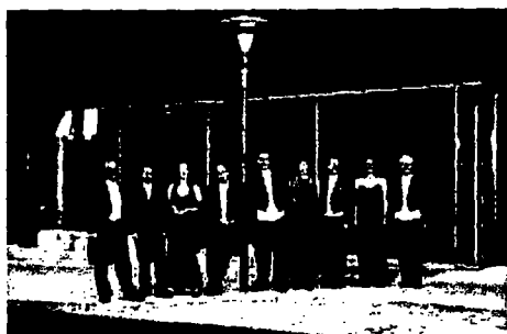
Det Jyske Ensemble består af ni fastansatte professionelle musikere.

Af Villy Dall, Thisted Dagblad, 10. december 2008