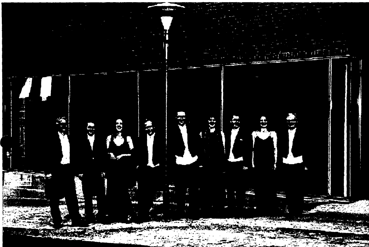
Kunstrådets musikudvalg har valgt at skære støtten væk fra ét af de seks basisensembler. Det går ud over Det Jyske Ensemble, der fra 2011 må finde støtten fra anden side.