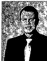
Martin Henriksen (DF)