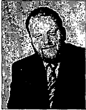
Lars Christian Lilleholt (V) Næstformand