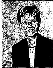
Rikke Hvilshøj (V)