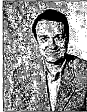
Michael Aastrup Jensen (V)