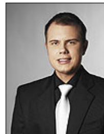
Martin Henriksen (DF)