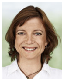
Karen Ellemann (V)