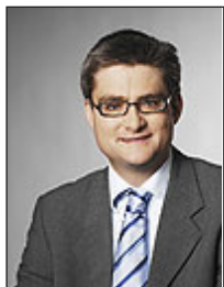
Søren Pind (V)