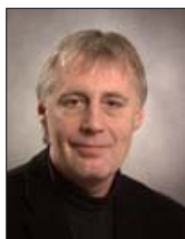
Henrik Dam Kristensen (S)