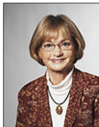
Pia Kjærsgaard (DF)