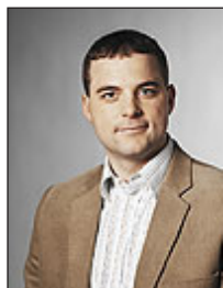
Morten Østergaard (RV)