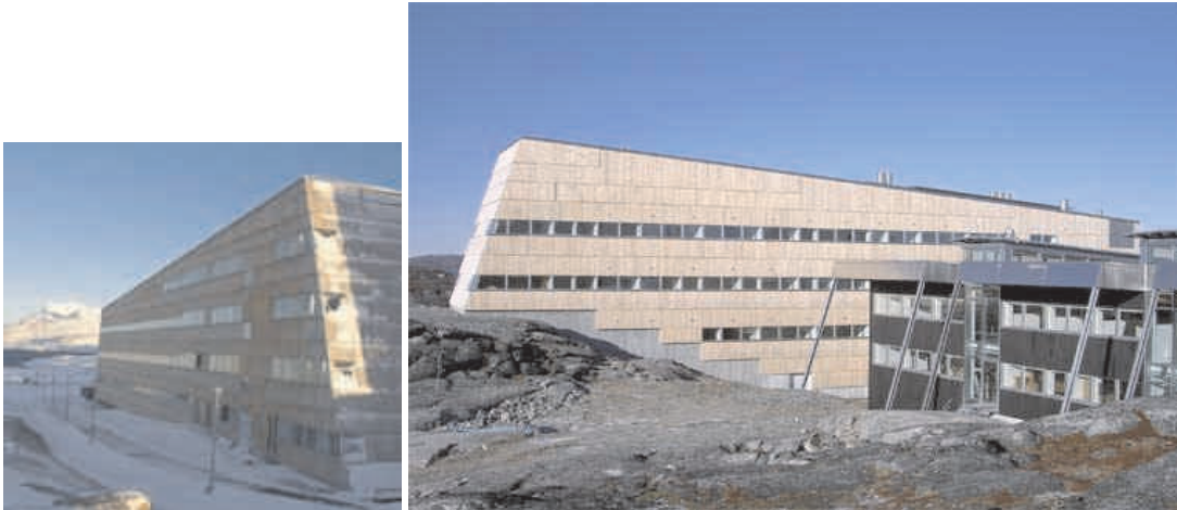
Grønlands nye universitetspark Ilimmarfik .

Jeg har i tidligere indberetninger orienteret om etableringen af universitetsparken Ilimmarfik i Nuuk.