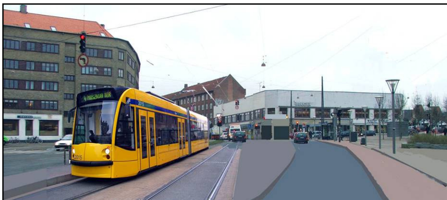
Brønshøj Torv med letbane i København. Visualisering: Jeppe Goll