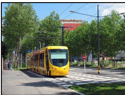
Ny letbane i Mulhouse, Frankrig Kunne dette være Amagerbrogade?

Vejkapaciteten blive forøget på en miljøvenlig måde, idet letbanen kan transportere ligeså mange personer som en 6-sporet motorvej.