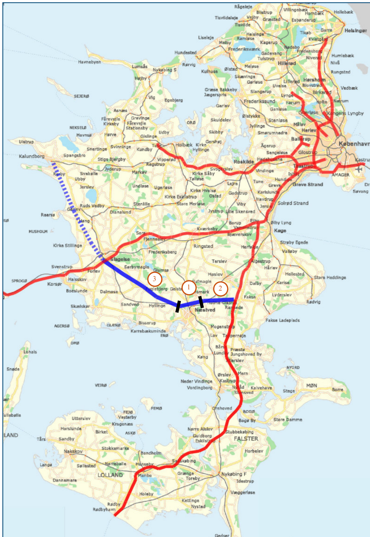
Gennemførelse af de 3 prioriterede projekter vil mindske trafikanternes rejsetid og forbedre trafikikkerheden