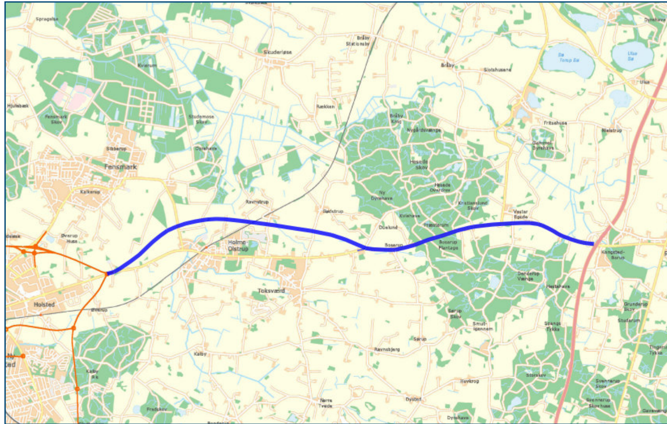
Forbindelse fra Næstved til motorvej ved Rønnede

Formålet er at forbedre og fremtidssikre den altafgørende vejforbindelse mellem Næstved Kommune og Sydmotorvejen, forbindelsen til hovedstadsområdet samt forbindelsen mellem Sydmotorvejen og Vestmotorvejen. En højklasset vejforbindelse giver både for indbyggerne i Næstved, for gæster og erhvervs-liv og for potentielle huskøbere et vigtigt signal om, at trafikken kan afvikles.