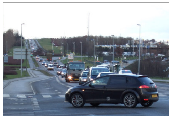
Bilkøer på Køgevej