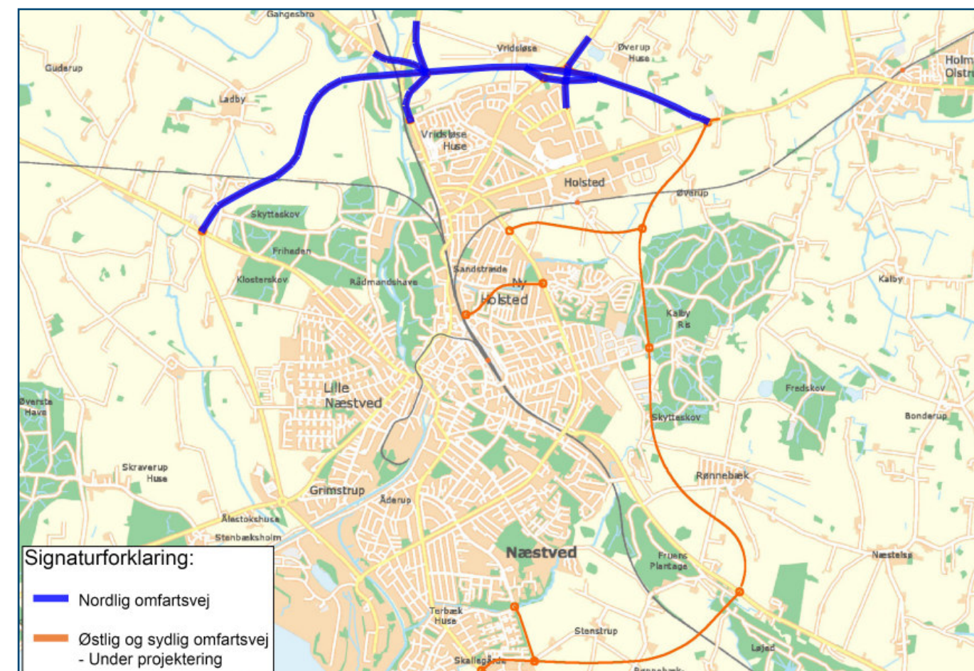
Omfartsvejen forbinder statsvejene ved Næstved

Hovedformålet med den nordlige omfartsvej er at skabe en nødvendig vejforbindelse mellem Sydmotorvejen og Vestmotorvejen. Endvidere vil strækningen skabe forbindelse mellem statsvejene Slagelsevej, Ringstedgade og Køgevej. Staten åbnede i 1997 1. etape af denne vej syd for Slagelsevej, og det er naturligt, at staten færdiggør forbindelsen til Køgevej.