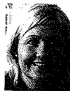
Carina Christensen Transportminister

Kort sagt: Giv dit besyv med og lad dig inspirere i samvær med transportvirksomheder, myndigheder og politikere.