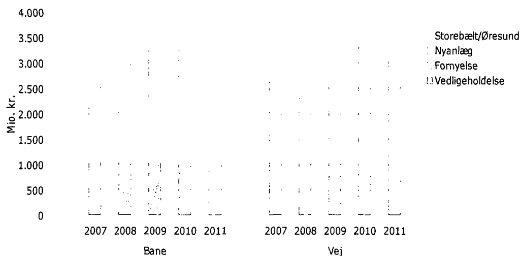
Figur 2. Bevillinger til baner og veje på FLO8

Infrastrukturbevillingerne til Banetrafik afspejler den politiske aftale om trafik fra november 2006, hvor der blev afsat en markant forøget bevilling til genopretning af jernbanenettet. Bevillingerne vedr. Storebælt/Øresund omfatter den statslige betaling til Sund og Bælt A/S for benyttelse af jernbaneforbindelserne over Storebælt og Øresund, herunder Kastrupbanen. Udgiften hertil udgør ca. 1.033 mio. kr. årligt og dækkes delvist af baneafgifter fra jernbaneselskaber (primært DSB) på ca. 570 mio. kr.