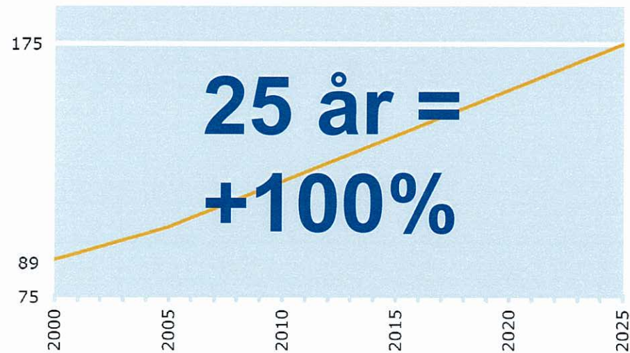
Figur 1.1 Skønnet udvikling i transporterede godsmængder til og fra Danmark i perioden 2000-2025 i mio. tons