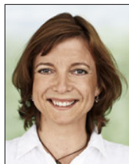
Karen Ellemann (V)