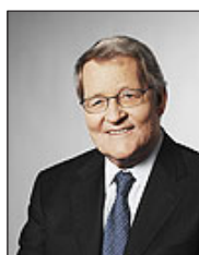
Niels Helveg Petersen (RV) Formand