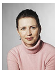
Mette Frederiksen (S)