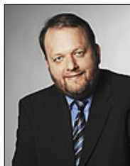
Lars Christian Lilleholt (V)