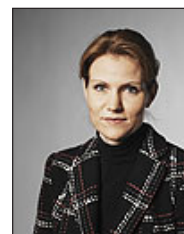
Helle Thorning- Schmidt (S)