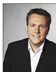
Morten Bødskov (S)