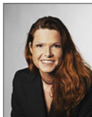
Inger Beinov Støjberg (V)