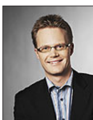
Jeppe Kofod (S)