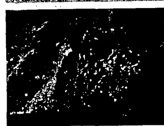
HØR DENNE UDSENDELSE SÅ VIL I FORSTÅ HVOR TÆT VI ER PÅ KATASTROFEN, DETTE KRÆVER AT