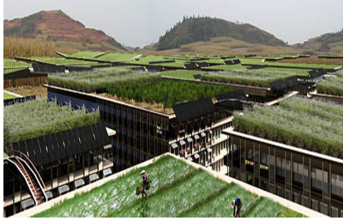
Opsamling, der kobler visionerne på København