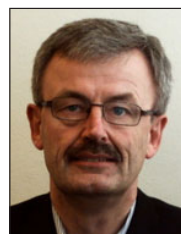
Henrik Høegh (V)