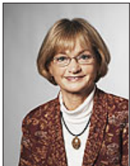
Pia Kjærsgaard (DF)