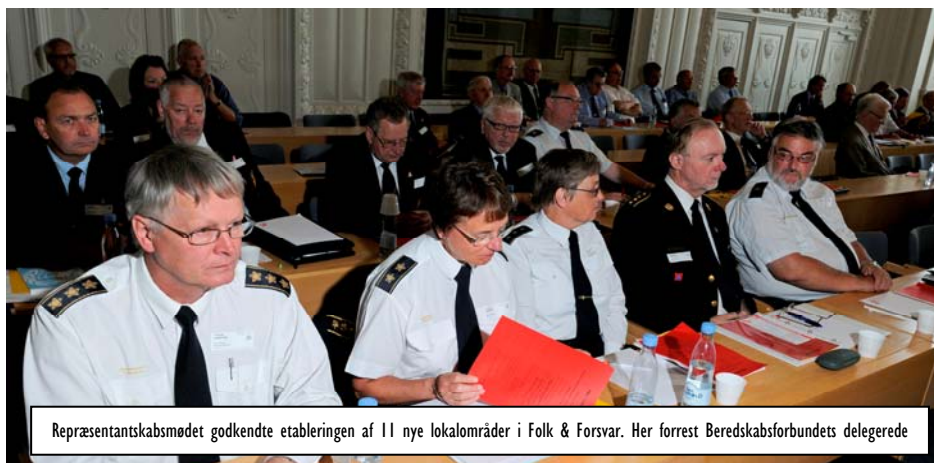
Repræsentantskabsmødet godkendte etableringen af 11 nye lokalområder i Folk & Forsvar. Her forrest Beredskabsforbundets delegerede

Bestyrelsen besluttede efterfølgende at følge projektgruppens anbefaling om en politikredsmodel – dog med en tilpasning i forhold til politikredsmødelen at samle medlemmer i det storkøbenhavnske område i ét lokalområde – Hovedstadsområdet.