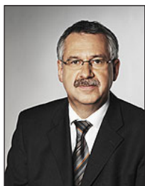
Hans Christian Schmidt (V) Formand