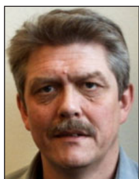
Karsten Hønge (SF)