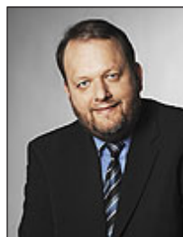
Lars Christian Lilleholt (V)