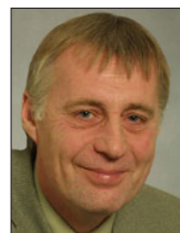
Henrik Dam Kristensen (S)