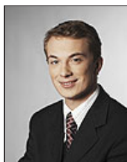
Morten Messerschmidt (DF)