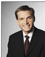
Kristian Thulesen Dahl (DF)