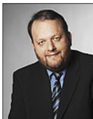
Lars Christian Lilleholt (V)