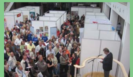
Claus Hjort Frederiksen holdt åbningstale for de mange fremmødte.

Mandag den 26. maj var der Jobmesse på Nationalmusset i Kbh. Sammen med Senior Erhverv i Kbh, Vestegnen og Køge viste vi flaget og fik delt en brochurer ud og fik talt med en masse 50-60 plusser.