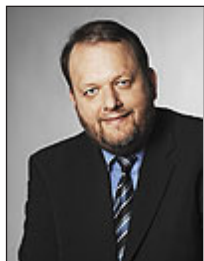
Lars Christian Lilleholt (V)