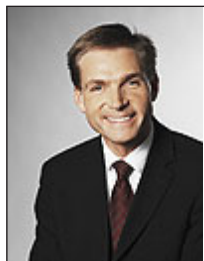
Kristian Thulesen Dahl (DF)