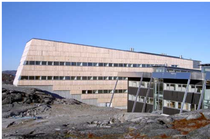
Grønlands nye universitetspark Ilimmarfik .