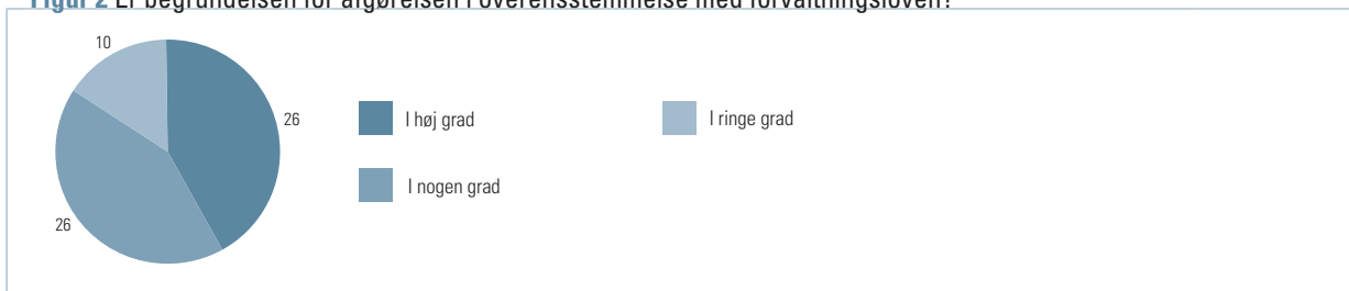
Figur 2 Er begrundelsen for afgørelsen i overensstemmelse med forvaltningsloven?

I 26 sager opfyldte begrundelsen for afgørelsen i høj grad forvaltningslovens krav herom, hvorimod dette var tilfældet i nogen grad i andre 26 sager, jf. figur 2 .