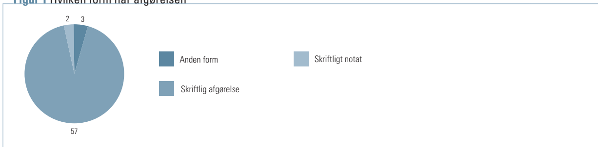
Figur 1 Hvilken form har afgørelsen

I 26 sager opfyldte begrundelsen for afgørelsen i høj grad forvaltningslovens krav herom, hvorimod dette var tilfældet i nogen grad i andre 26 sager, jf. figur 2 .