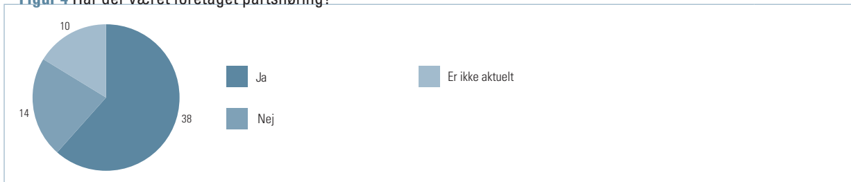
Figur 4 Har der været foretaget partshøring?

I 38 sager har kommunerne partshørt borgeren, inden der blev truffet afgørelse, jf. figur 4.