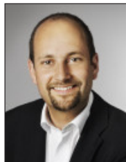
Rasmus Prehn (S)