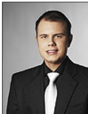
Martin Henriksen (DF)