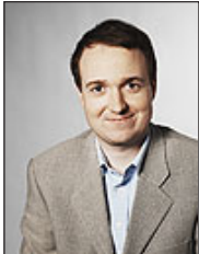
Michael Aastrup Jensen (V)