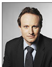
Martin Lidegaard (RV)