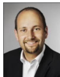
Rasmus Prehn (S)