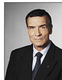
Helge Adam Møller (KF)