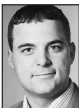
Morten Østergaard (RV)