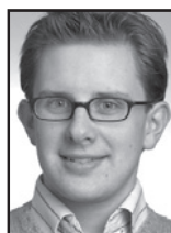
Simon Emil Ammitzbøll (RV)