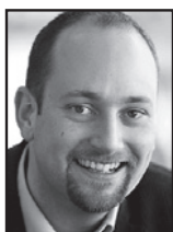
Rasmus Prehn (S)