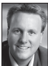
Morten Bødskov (S)