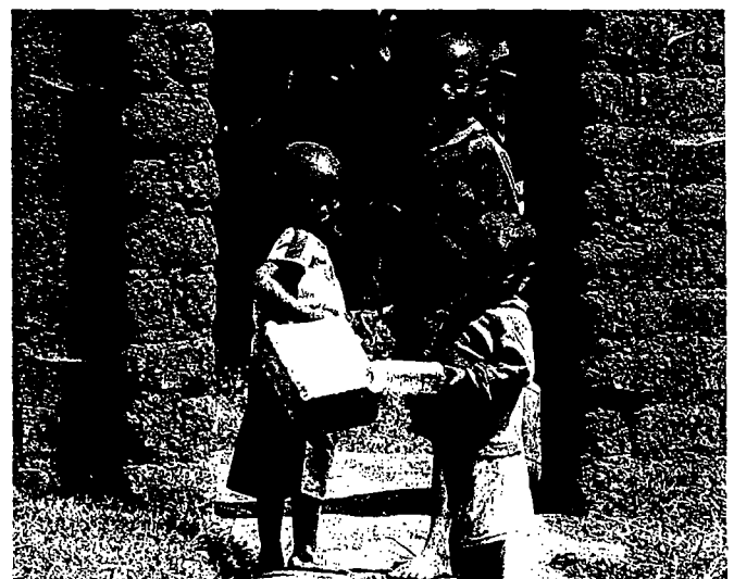
Forældreløse børn i Burundi