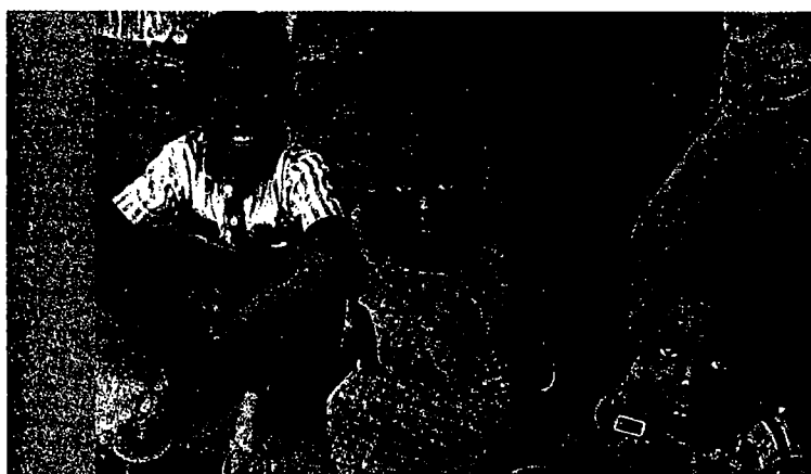
for ældre børn i Birland (side 2)

Kontingent vil blive opkrævet via PBS i løbet af foråret, og vi anbefaler, at du melder dig til, så det fremover kører automatisk, idet det bliver meget nemmere for både dig og KIT.