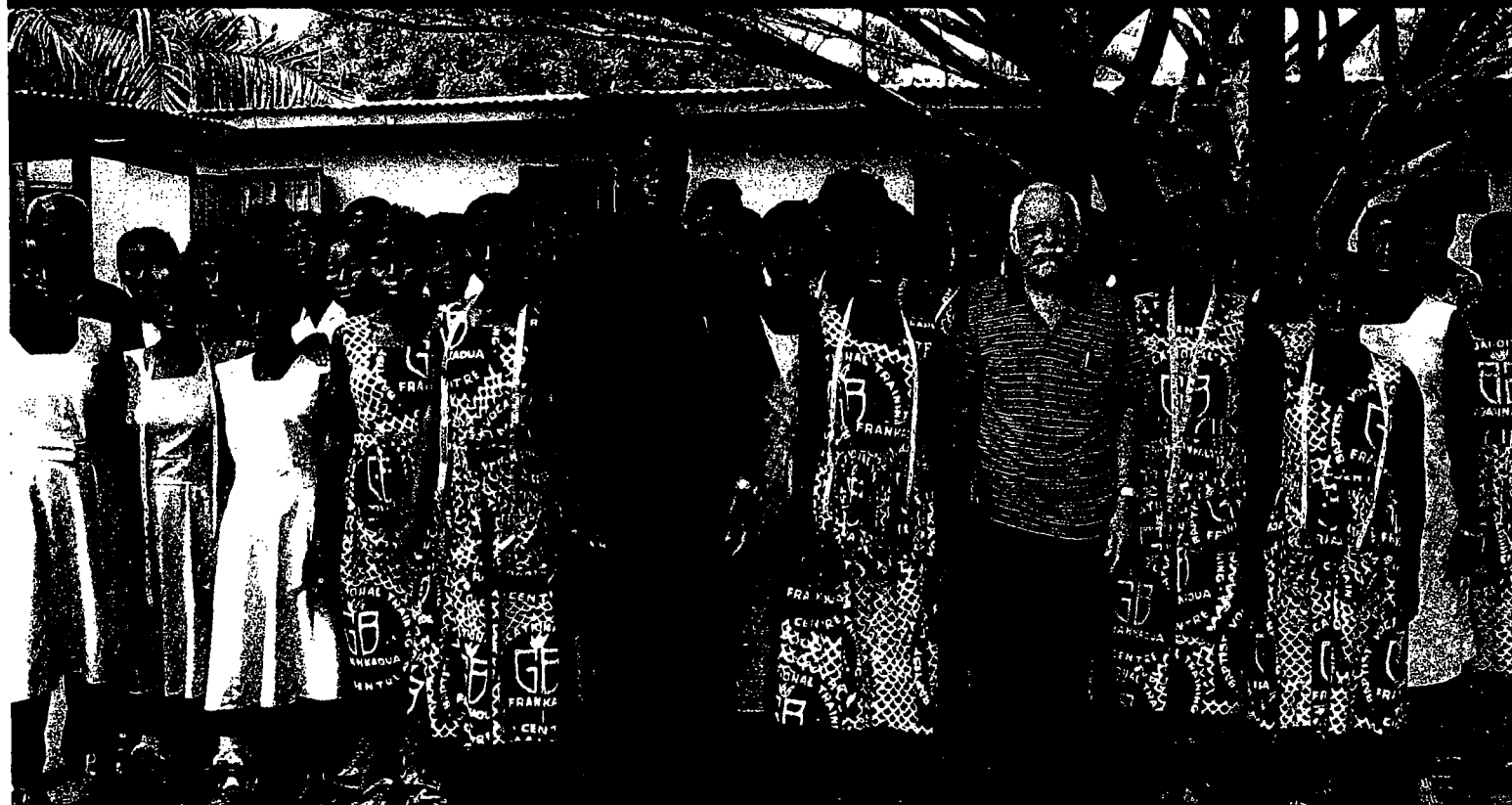
Et gruppebillede med eleverne (tidligere slævepiger af Trokosisystemet) på Baptistkirken i Ghanas træningscenter