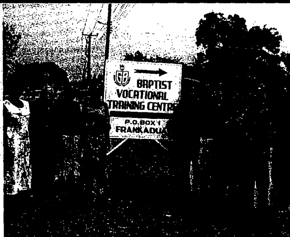
Personalet på Vocational Training Centre i Frankadua, Ghana.

Hvis de er heldige at blive frigjort fra forholdet, tager familierne dem sjældent tilbage, da de efterfølgende betragtes som ulykkesfugle for familien. I deres ensomhed og isolation ender