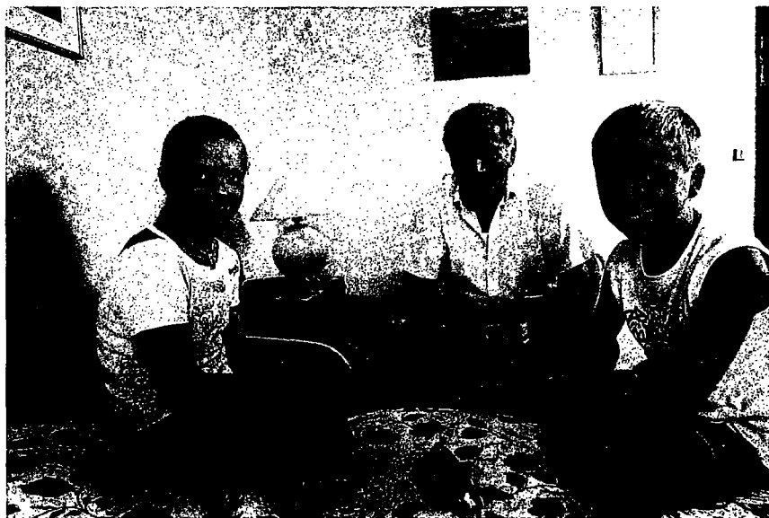
Tvillingepar behandlet – Hendes Verden nr. 26-2006