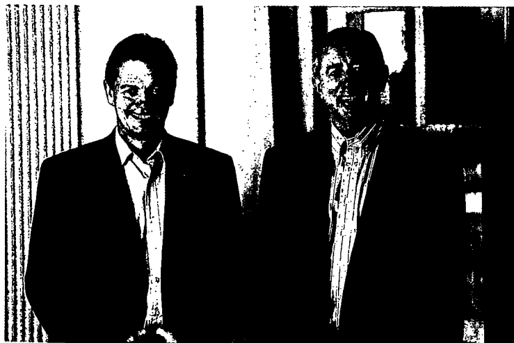
Økonomi- og erhvervsminister Bendt Bendtsen og transport- og energiminister Flemming Hansen