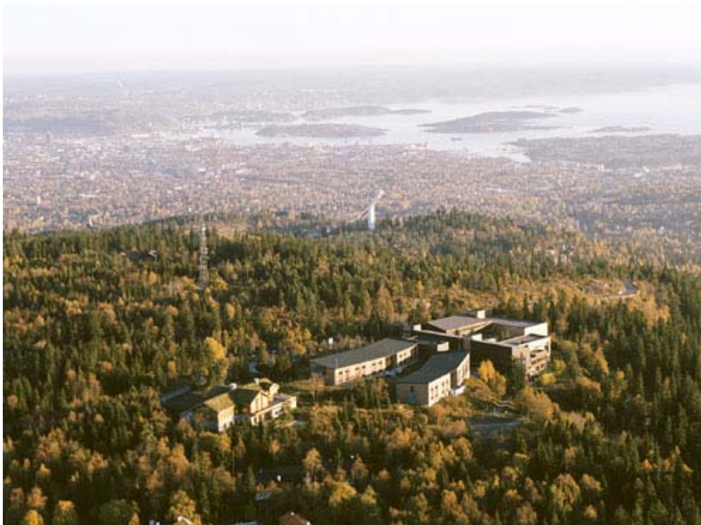
Flyfoto: Soria Moria foran, hoppbakken i Holmenkollen og Oslo sentrum bak.