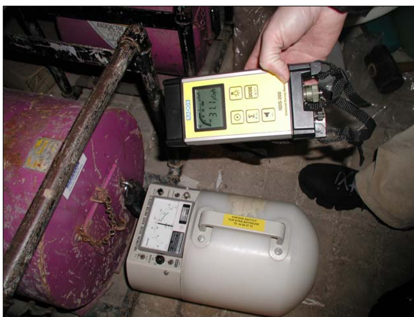
Figur 1. Besigtigelse af transportbeholdere og opbevaringssted i 2006

Radioaktive forsendelser med tilhørende transportdokumenter, benyttede transportmidler og transitopbevaringssteder, samt virksomheder, der udvikler, fremstiller og vedligeholder kildeindkapslinger og transportbeholdere er underlagt tilsyn af SIS (Figur 1). SIS skal til enhver tid have adgang til sådanne forsendelser og virksomheder.