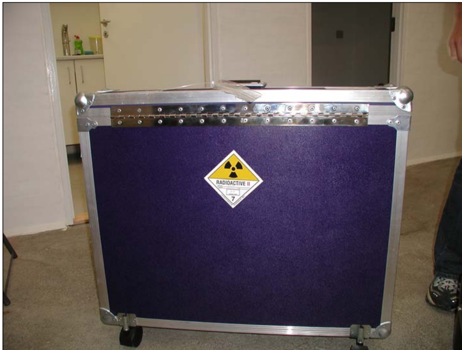
Figur 2. Transportbeholder ved nyetableret dansk dyrehospital.

I juni 2006 gennemførtes en vejtransport af kraftige Co-60 kilder til/fra det største af landets tre bestrålingsanlæg. I henhold til ADR skal der foreligge særlige sikringsplaner for transport af kraftige strålekilder. Sådanne forelå for den pågældende transport.