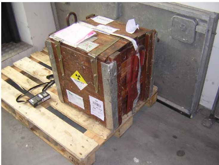
Figur 4. Beskadiget forsendelse tilbageholdt i Kastrup lufthavn.

I marts 2006 rapporterede Safety & Security Manager ved SAS Cargo Operations Danmark at en forsendelse med radioaktivt indhold, som var i transit i Kastrup på vej mellem Amsterdam og Budapest var beskadiget (Figur 4). Vagthavende på SIS besigtigede forsendelsen og konstaterede at beskadigelsen kun berørte kolliets ydre emballage og at det var sikkert at lade forsendelsen stå i transitopbevaringsrummet indtil afsenderen havde repareret kolliets ydre emballage. Uheldet er klassificeret som »INES 0«.