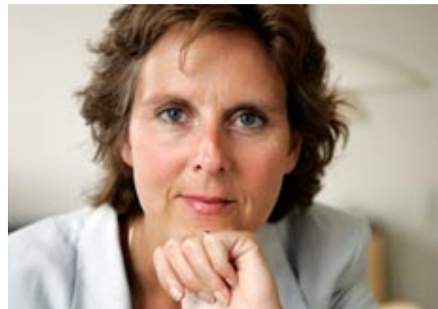
Miljøminister Connie Hedegaard.

Oversigten udgør et øjebliksbillede af de planlægningsmæssige vilkår, som de tager sig ud her ved indgangen til den nye tid, men udviklingen har fart på, og der stilles stigende krav til