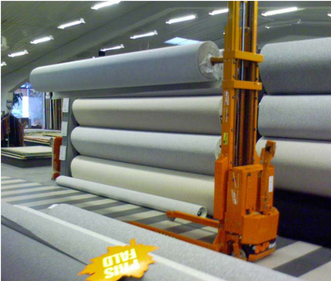
Ophængning af tæpperuler med truck i butik