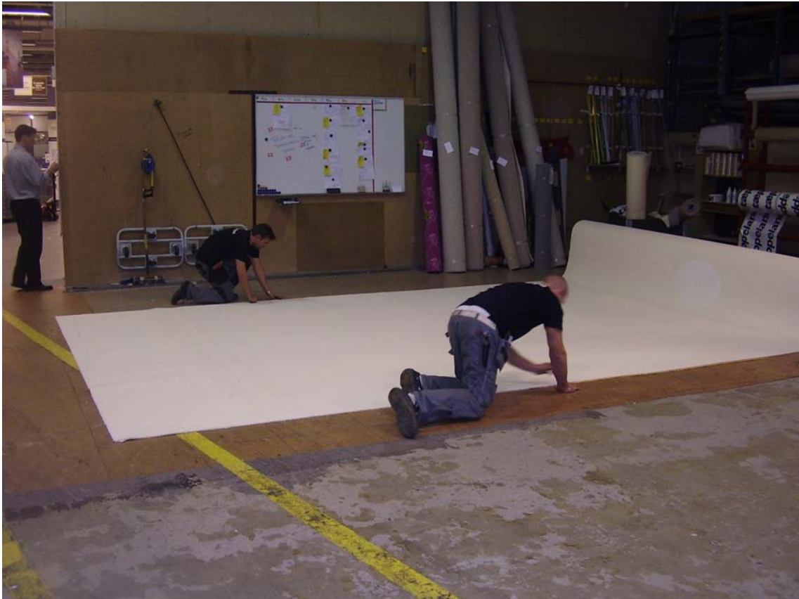
Tilskæring af tæpper