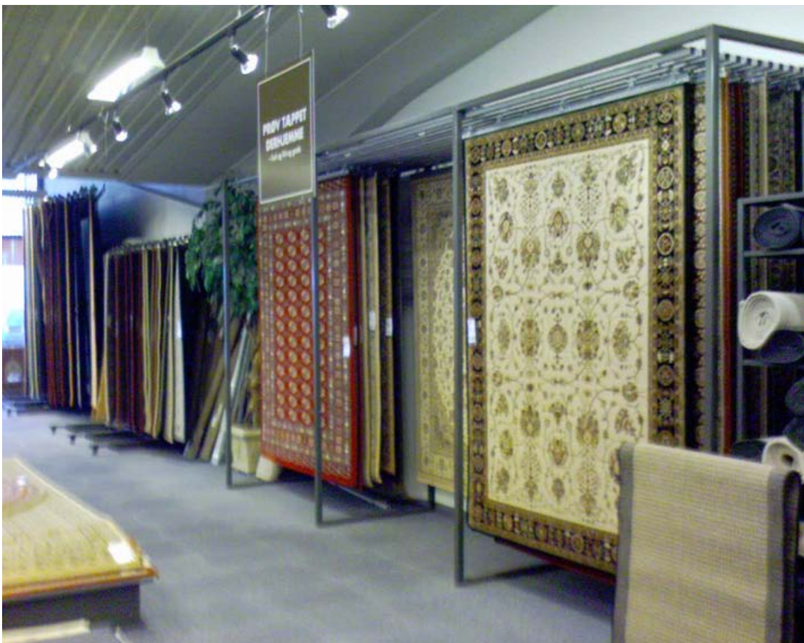
Vægophæng af løse tæpper i butik