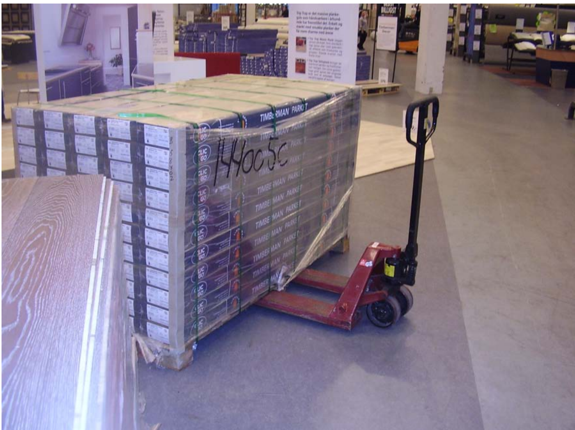
Kørsel med palletøfter