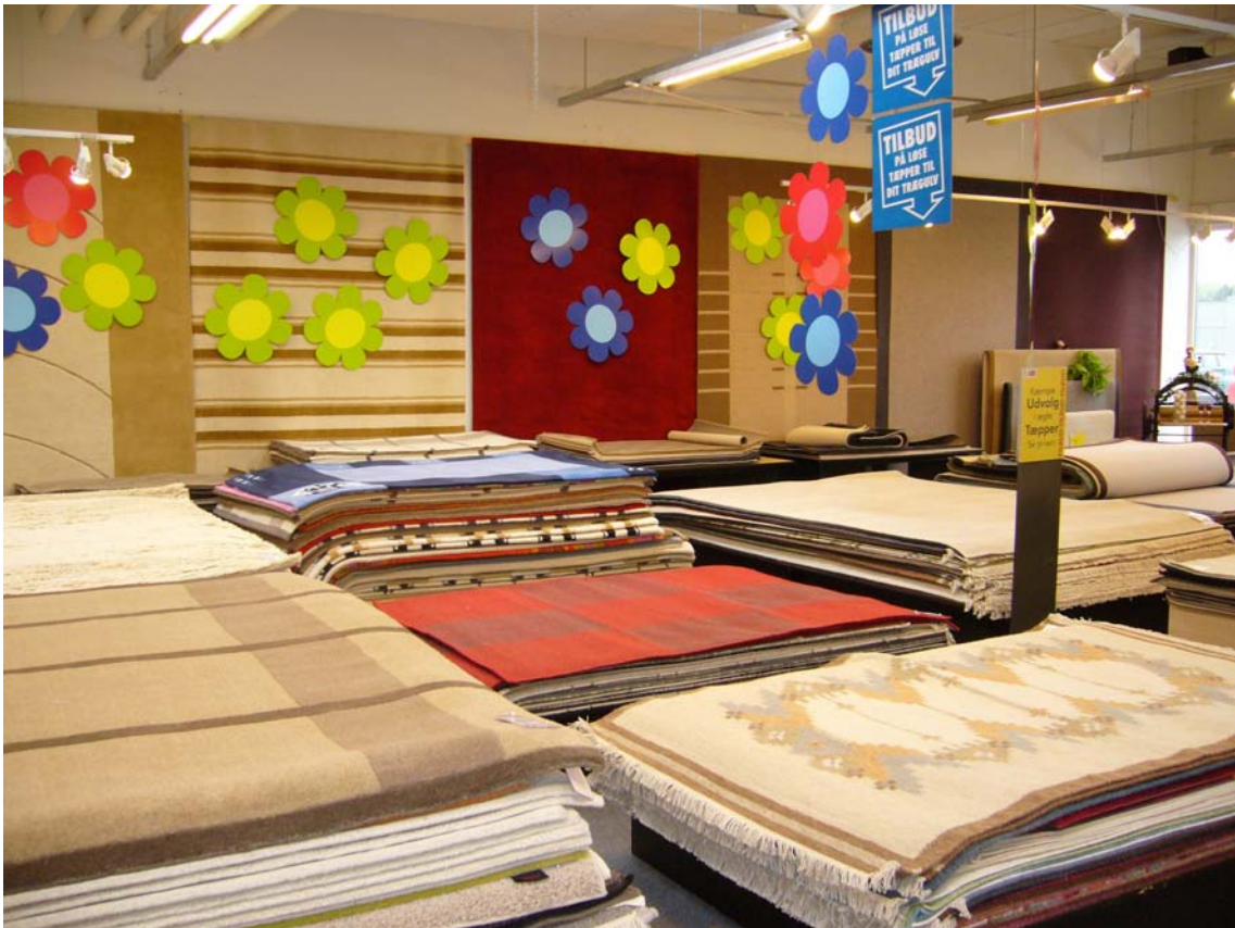
Podier til løse tæpper i butik