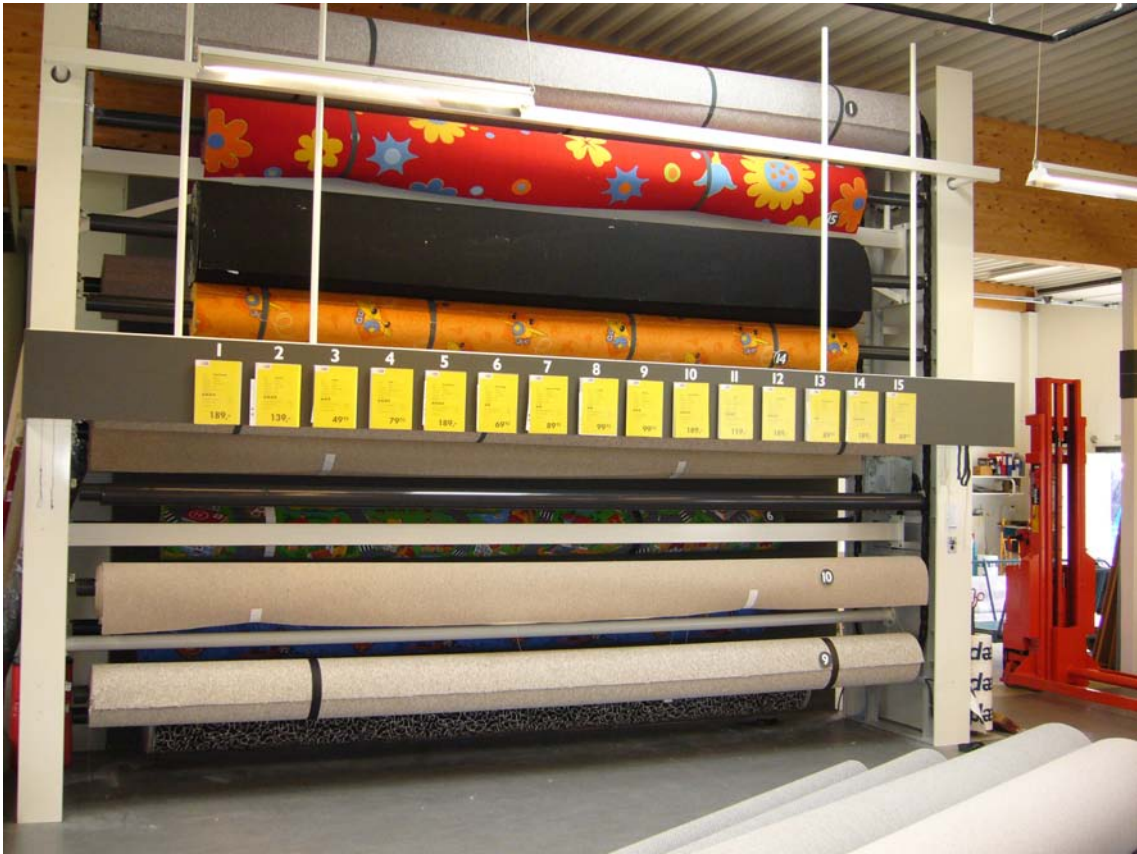
Padanoster med tæpperuller