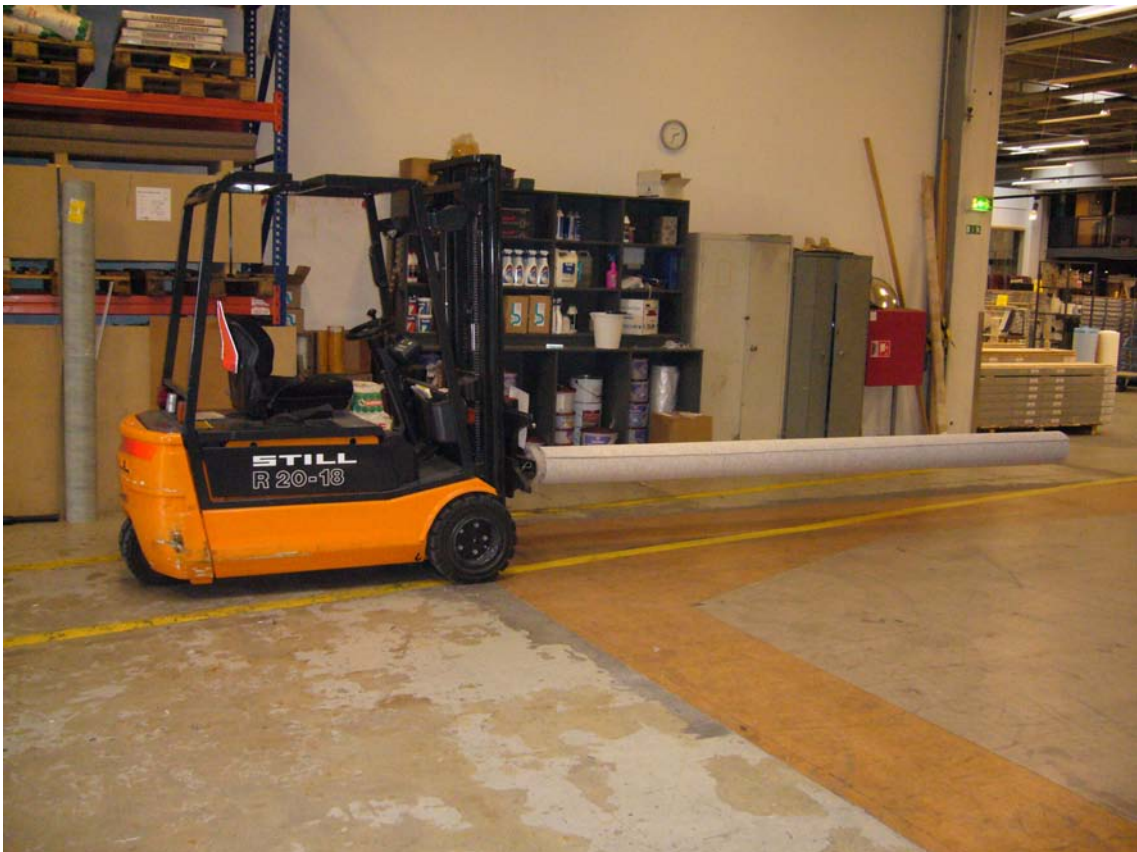
Truck kørsel på lager