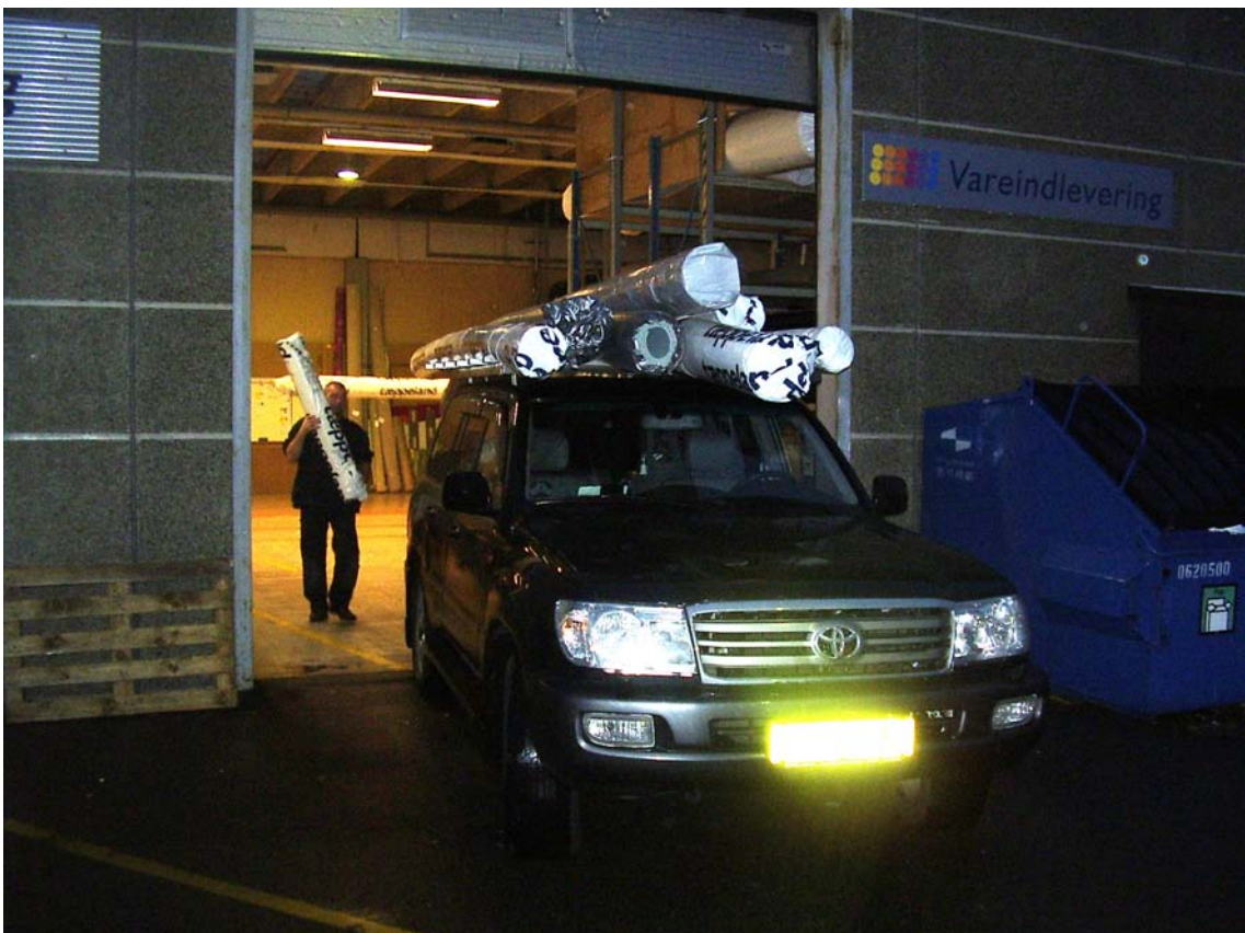
Afhentning af tæpper