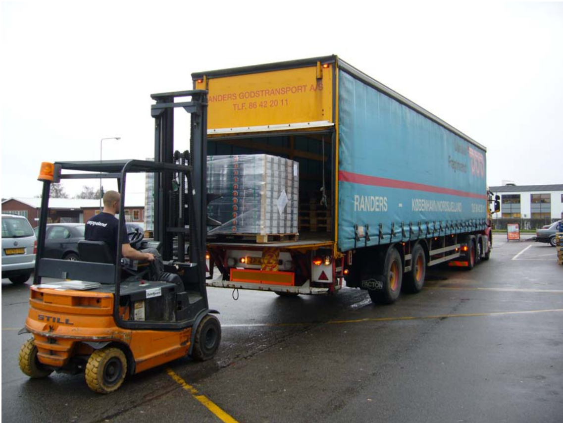
Varetilgang pr lastbil