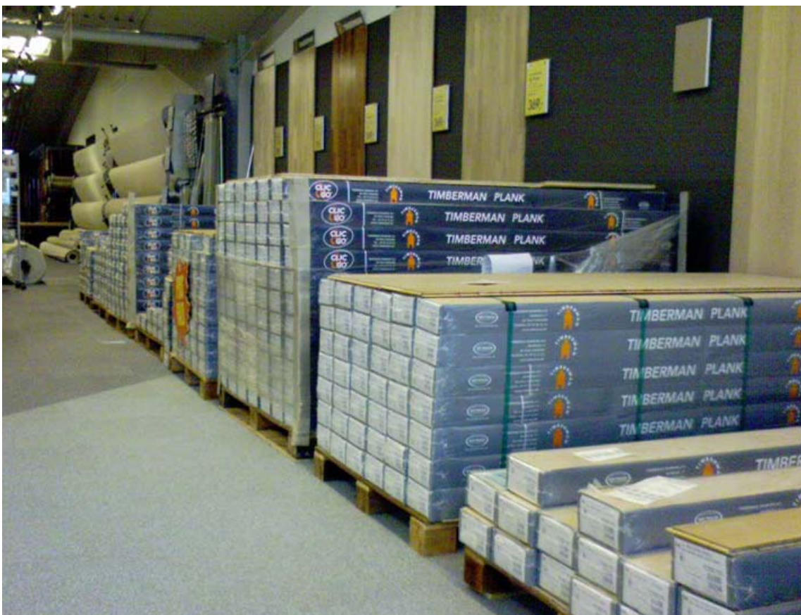
Træpaller i butik