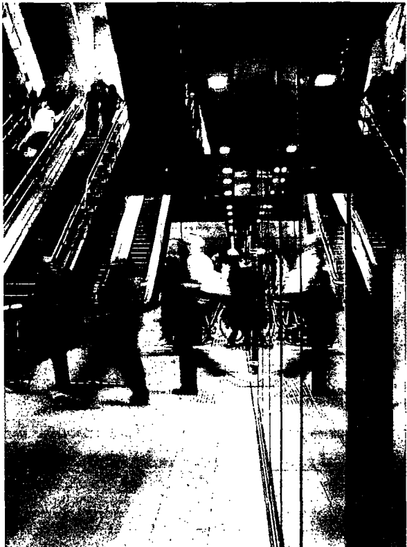
Illustration: schmidt hammer lassen

Kunstmuseet Aros i Århus gennemskæres af et stort buet rumforløb, der som en offentlig stiforbindelse forbinder gader og pladser på hver sin side af museet. Samtidigt synliggør museets skulpturelle trappeanlæg bygningens 10 etager.