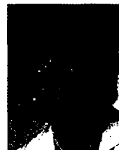
Birthe Skaarup Formand for Folketingets Sundhedsudvalg (DF)