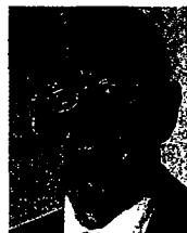
Poul Erik Christensen Medlem af Folketingets Erhvervsudvalg og Skatteudvalg (RV)