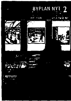
BYPLANNYT nr. 2 / 2007 (5. årgang)

Redaktion Ellen Højgaard Jensen (ansv.) Annette Thierry