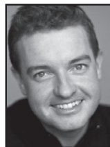
Jens Rohde (V)