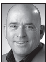
Søren Espersen (DF)