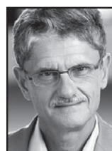
Mogens Lykketoft (S)