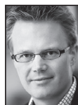
Jeppe Kofod (S) Næstformand