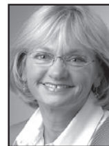
Pia Kjærsgaard (DF)