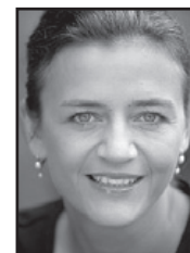
Margrethe Vestager (RV)