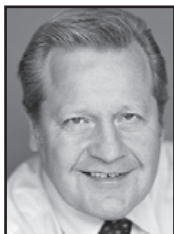
Svend Erik Hovmand (V)