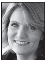
Helle Thorning- Schmidt (S)