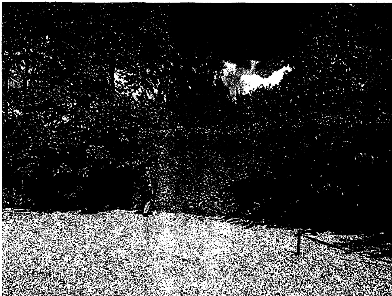
Voldens højde nord for stationen