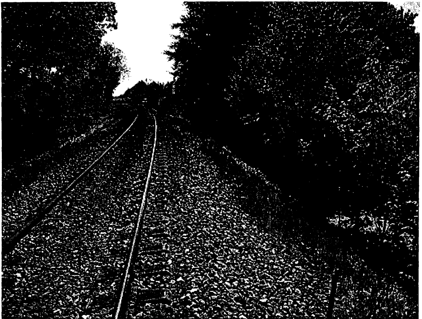
Mod stationen set fra nord