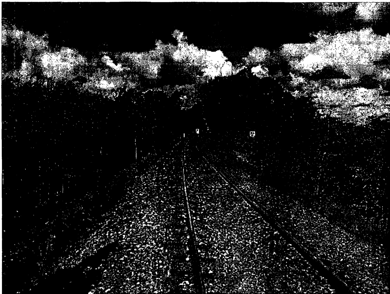
Set mod Holbæk