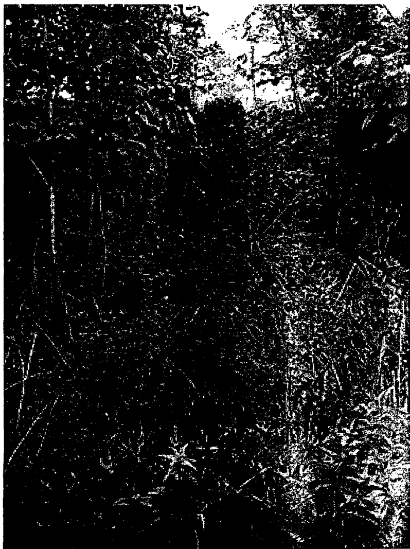
Voldens højde syd for stationen