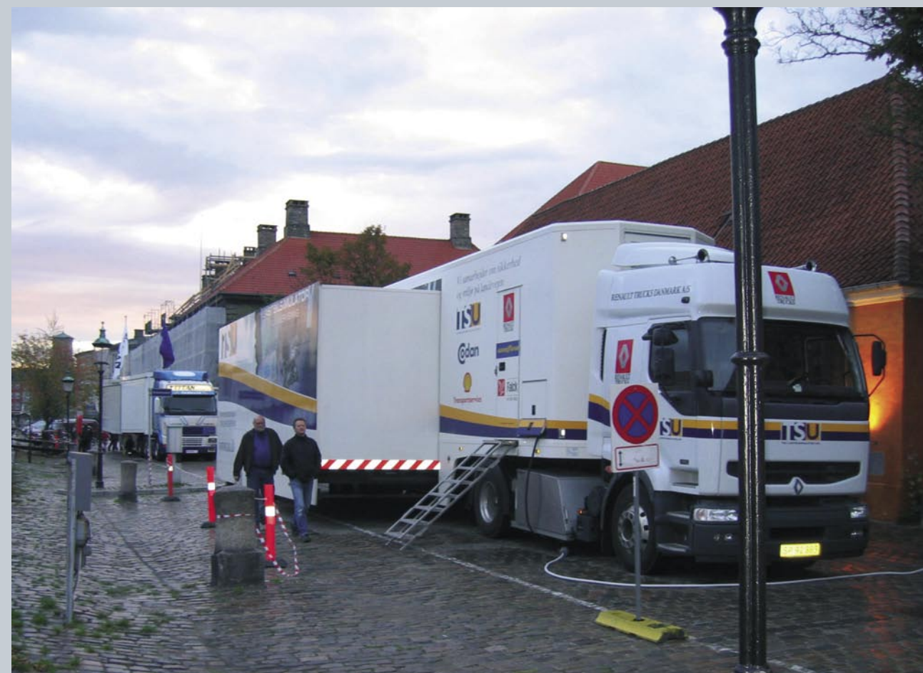
Foto fra Kulturnatten i oktober 2004 i København, hvor der var åbent hus i TSU's lastbilsimulator uden for Transportministeriet på Frederiksholms Kanal. (Foto fra Transport- og Energiministeriets hjemmeside).