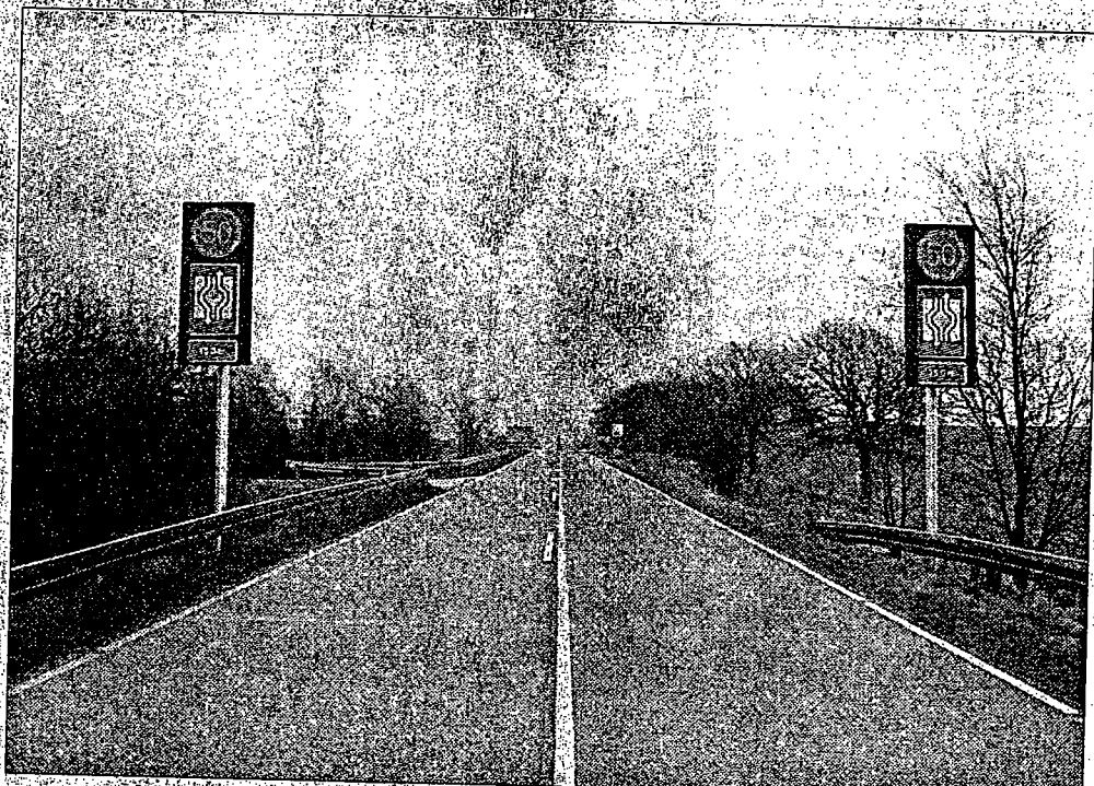
Vejdirektoratet har i flere omgange arbejdet med at reducere bilisternes fart på Viborgvej ved Svenstrup. Nu skal der laves et bump ved en omstridte vejchikanen.

I løbet af de seneste år er der sket en række alvorlige trafikulykker i chikanen på Viborgvej. Ved flere af ulykkerne er de involverede biler havnet inde i private haver