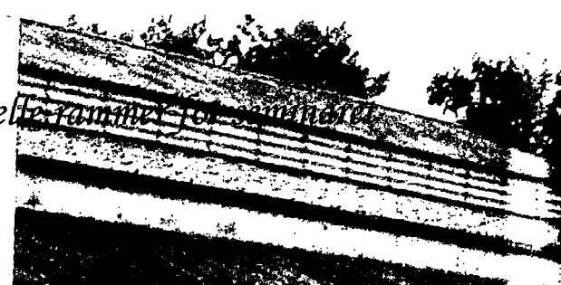
En weekend blev brugt på at skabe et forum, hvor unge med forskellige handicap kunne komme til orde.