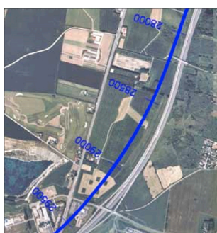
Det nye spor løber tværs igennem Firemileskoven.

Hedeboegnen er meget fattig på skov. Men Firemileskoven på ca. 85 ha ligger tæt på det store byområde ved Karlstrup, Solrød og Jersie Strand og har dermed en væsentlig rekreativ betydning for borgerne. Det var netop beliggenheden, som fik staten til at opkøbe området til skovrejsning i 1980'erne. Firemileskoven er smal og lang. Et nyt jernbanespor vil gennemskære skoven og gøre den ubrugelig til rekreative formål.